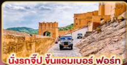
มังกรจีป ขึ้นแอมเบอร์ ฟোর্น