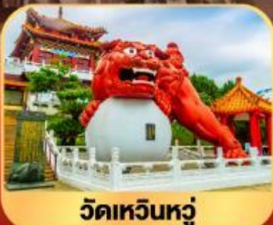
วัดเหวินหลู่