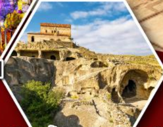
เมืองถ้ำอพลิสตซิเคห์

พัก Rooms Hotel โรงแรมวิวิลักษณ์ของเทือกเขาคอเคซัส