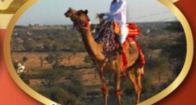
ฟรี ขี่อูฐ เมืองมันทอวา ราคาเริ่มต้น