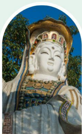
เจ้าแม่กวนอิม ธิพลสัย