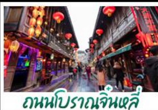
ถนนโบราณจั้นหลี่