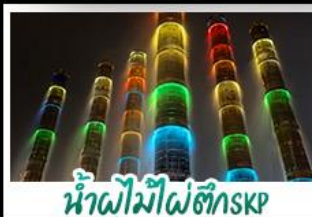
น้ำพุไม้ไผ่ตึกSKP