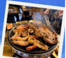
ปิ้งย่าง