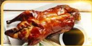
เปิด Four Season