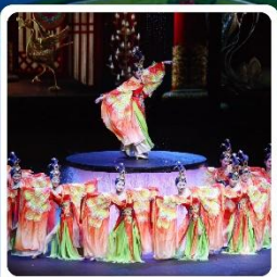
โชว์ FOSHAN QIANGQING