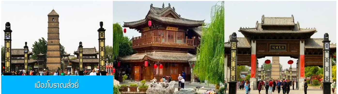
เมืองโบราณฉว่หยี่

ขบวนรถไฟนำคณะเดินทางถึงสถานีรถไฟนครฉว่หยาง นำคณะขึ้นรถบัสเพื่อเดินทางสู่นครฉว่หยาง