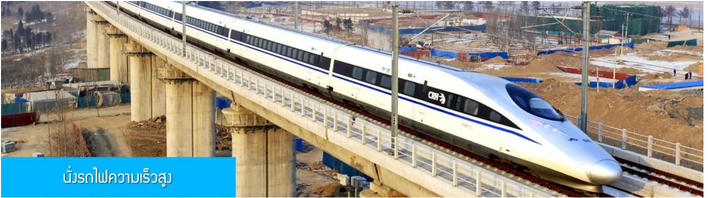
บริการรถไฟความเร็วสูง

หลังอาหารนำท่านเดินทางสู่สถานีรถไฟความเร็วสูงนครซีอาน เพื่อเตรียมเดินทางสู่นครฉว่หยาง