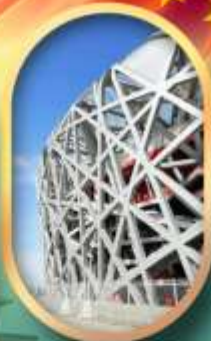
ผ่านชมสนามกีฬาาริงนก