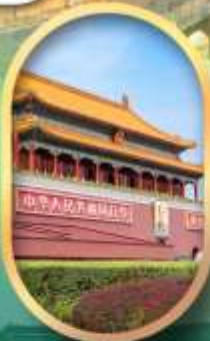
จัสมุขเทียนอันเหมิน