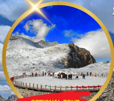
OPTIONAL TOUR ธารน้ำแข็งต่าตูปิงชเวน