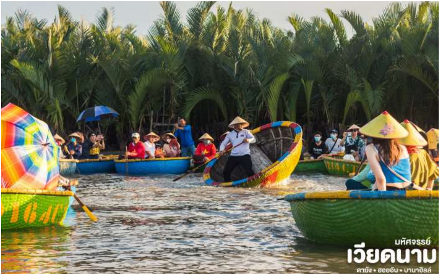
บทวิจารณ์ เวียดนาม ดาบิง • ฮอยอัน • บานาฮิลล์