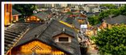
เมืองโบราณสือปาตี