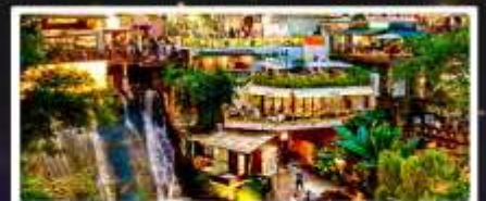
ถนนโบราณหลงเหมินฮ่าว