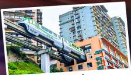
รถไฟฟ้าทะลุตึก