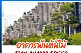
อาคารพันต้นไม้อู๋เทียนอัน 1000 TREES