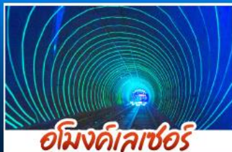
อู๋มิงดีเลเซอร์