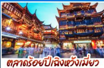
ตลาดร้อยปีลิ่งเซียงเหมิงฮว