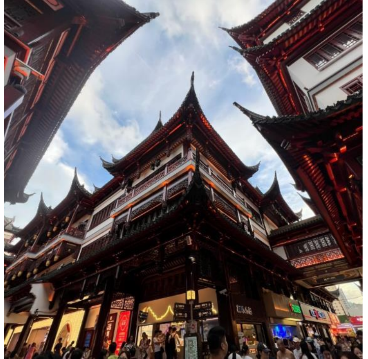
กลางวัน รับประทานอาหารกลางวัน ณ ภัตตาคาร (มือที่ 2)