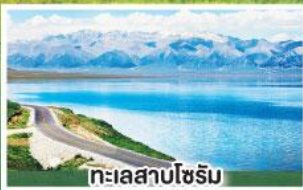
ทะเลสาบไซรัม