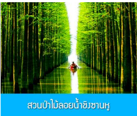
สวนป่าไม้ลอยน้ำชิงซานหู

พักที่ PAIJING HOLIDAY HOTEL โรงแรมระดับ 4 ดาวท้องถิ่น หรือเทียบเท่า เมืองหวงซาน