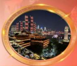
มือค้ำร้านอาหารอวโหล่งล้า