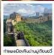
กำแพงเมืองจีน/หุบเขาเทียนถัน