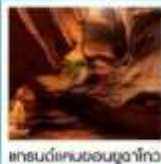
แกรนด์แคนยอนยูลาโกว