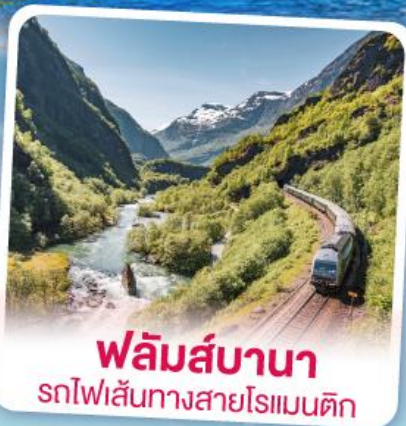
พลัมส์บานา รถไฟเส้นทางสายโรเมนติก